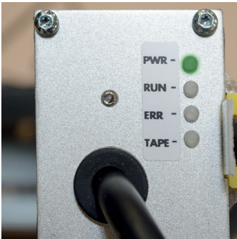
Capteur absolu Limax