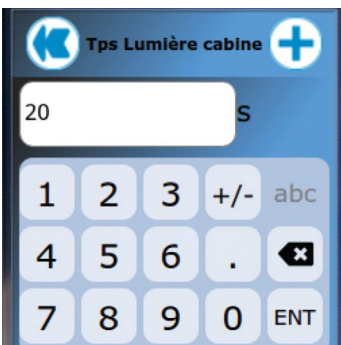
Écran tactile Qitouch